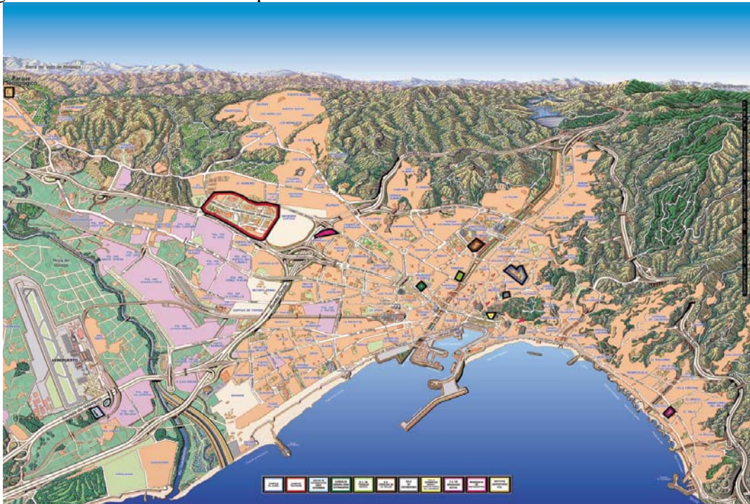
Plano del Campus de Teatinos (existe una biblioteca en cada edificio y en el Aulario I):